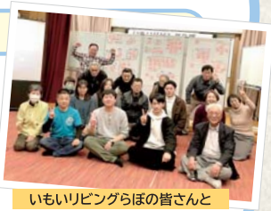
いもりリビングらぼの皆さんと